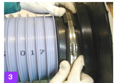
図 3. 締結ゴムによる固定(2)