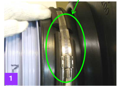
図 1. 締結ゴムによる固定(1)