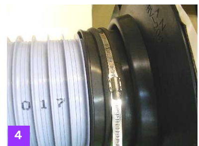
図 4. 締め付け完了